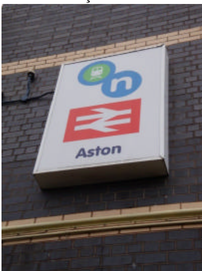
Placa na estação de trem de Aston – Birmingham

Chegando em Aston, constatei o porque da pergunta sobre o jogo: centenas de pessoas desembarcaram na mesma estação que eu pois haveria um jogo que começaria dali a pouco, Aston Villa contra West Bromwich Albion. Ingleses são apaixonados por futebol. E, para quem não sabe, Geezer Butler é torcedor fanático do Aston Villa. Resolvi seguir o fluxo em direção ao estádio.