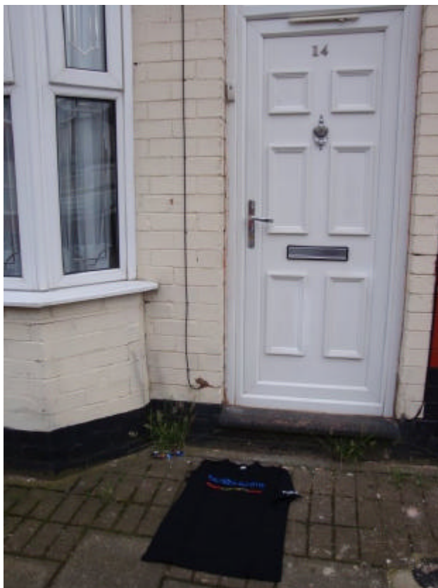
Camiseta exclusiva fanzmosis em frente à casa onde Madman nasceu

Levei comigo a camiseta do Fanzmosis feita especialmente para os shows do Ozzy no Brasil nos dias 03 e 05/04/08, em sua última turnê. Foi usando ela que tive a incrível chance de conhecer Ozzy e a idéia agora era tirar fotos com a camiseta em frente à casa. Impossível usá-la devido ao frio que fazia (fui na época mais rigorosa do inverno inglês), o que fez surgir um pequeno obstáculo: por estar sozinho, não havia onde prender a camiseta, e não foi possível prendê-la na porta, nem pela maçaneta, etc. Não tive escolha: tirei fotos com ela no chão. Um pouco fora da idéia original, mas o melhor que pude fazer no breve tempo que tinha.