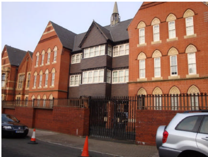
Kind Edward VI – A escola onde Ozzy e Tony estudaram juntos

A escola fica na Frederick Road, e descobri que o pátio é usado como estacionamento para os fãs de futebol em dias de jogo, já que a escola fica muito perto do estádio do Aston Villa e de um parque que existe na região, chamado Aston Park.