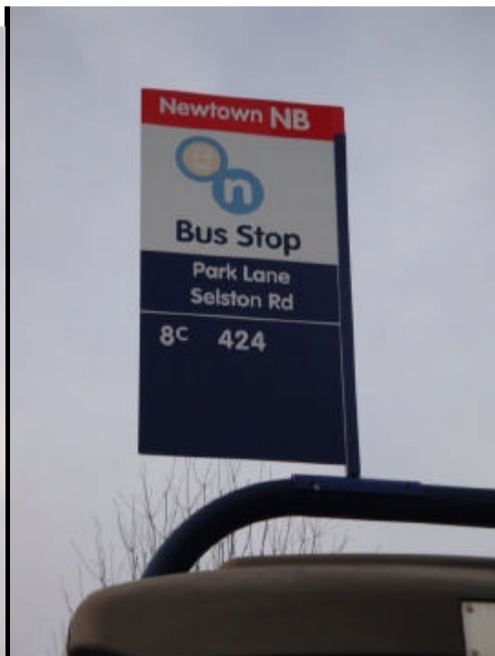
Placas de pontos de ônibus que indicam a conectividade entre a rua de Geezer e a de Tony