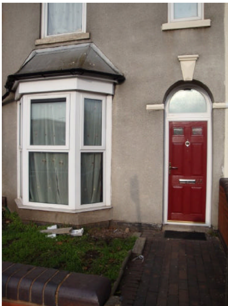
A frente da casa, em detalhes

Um ponto interessante é que praticamente em frente à casa de Geezer está a Selston Road. Seguindo até o final dessa rua a pé (uma grande descida) chega-se a Park Lane, a rua onde Tony Iommi morava. Extremamente perto, questão de poucos quarteirões de distância.