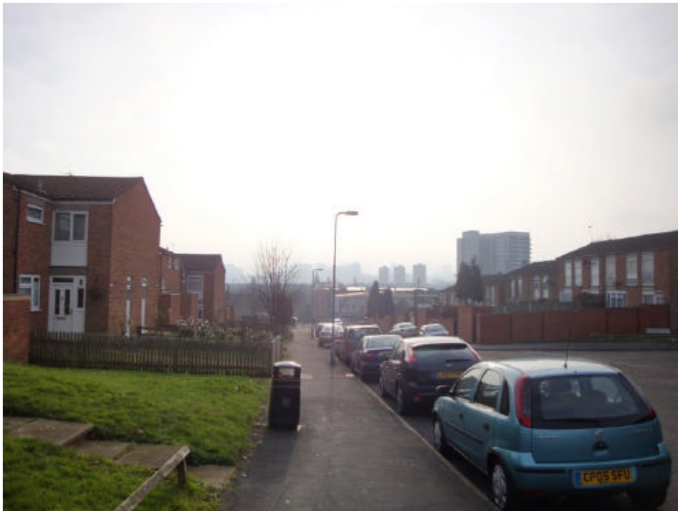
Vista da Selston Road – uma descida que leva até a casa onde Tony Iommi vivia