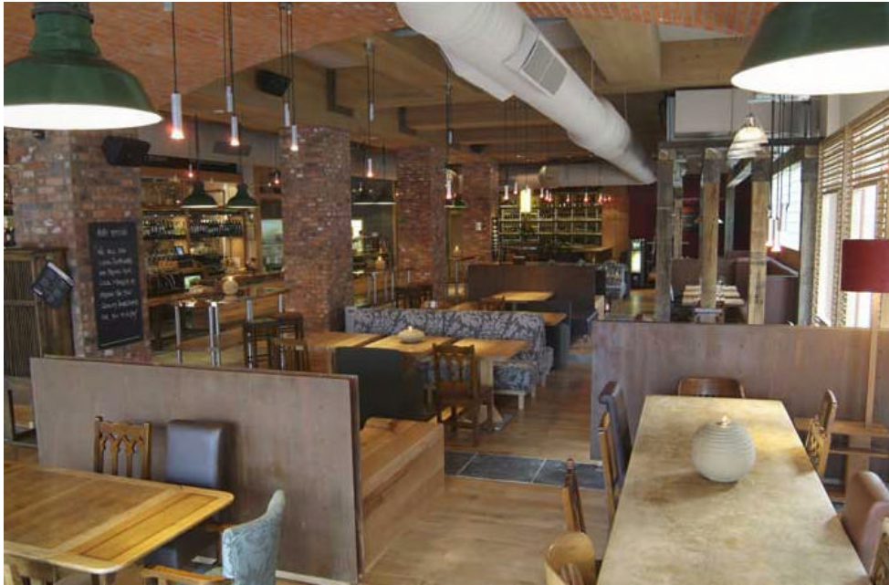
Imagem do Pub, retirada do website próprio http://www.penny-blacks.com/ . Visite!