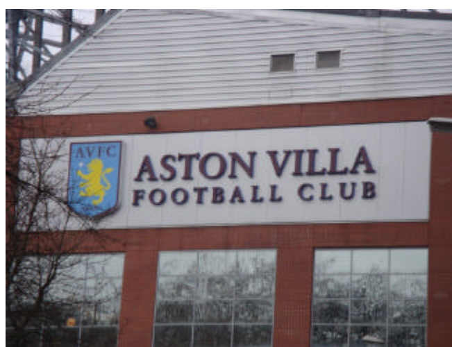
Imagem do estádio do Aston Villa FC,

Logo pensei: que sorte a minha ter escolhido um domingo onde haveria um jogo para a visita! Ao menos a cidade estava cheia e assim não parecia haver problema algum em transitar sozinho por lá.