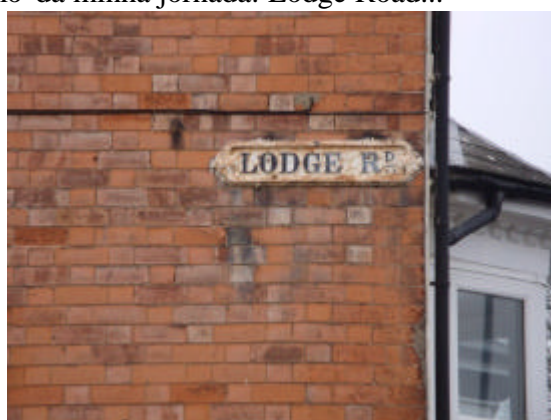
Foto da placa indicando o nome da rua onde Ozzy nasceu

Após algumas perguntas aqui e lá, uma simpática senhora inglesa me indicou a rua que representaria o real início da minha jornada: Lodge Road...