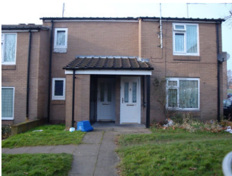
Casa de Tony – Somente a porta branca da esquerda

Inclusive hoje em dia a casa tem bastante lixo em sua fachada, como se pode ver nas fotos.