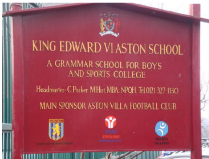
Placa na Entrada da escola