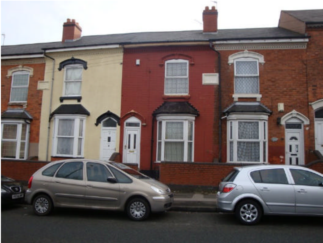
A suposta casa de Bill, vermelha, no meio da foto. Infelizmente um engano

Após tirar fotos dessa última casa, dei graças a Deus que havia visitado tudo que queria e nada havia me acontecido: só queria saber de voltar para a estação o mais rápido possível.