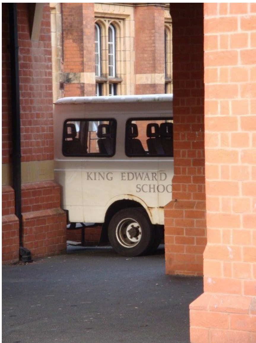
Antigo ônibus da escola. Se bobear, Ozzy e Tony já foram transportados nele um dia...

Para quem quiser mais informações, a escola possui um website oficial http://web.keaston.bham.sch.uk/ka/school/home e um descritivo na Wikipedia http://en.wikipedia.org/wiki/King_Edward_VI_Aston .