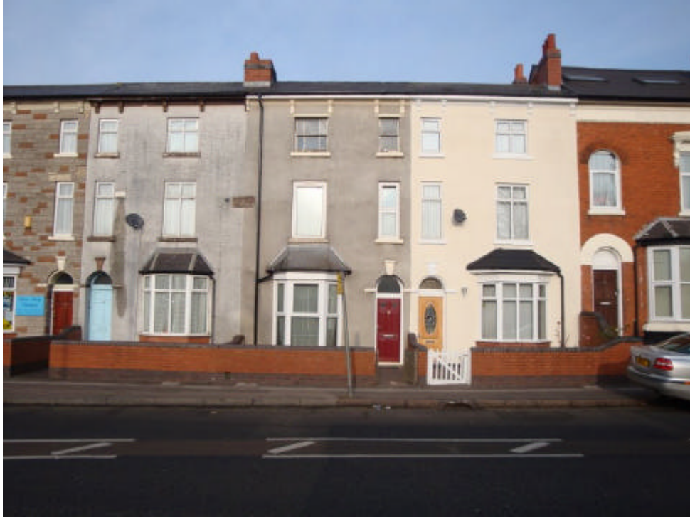
A casa onde Geezer vivia, no centro da foto, com a porta vermelha