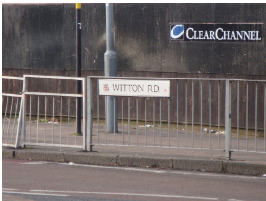
Witton Road, a rua da dúvida: Bill morava ali ou na Witton Lodge Road?

Neste momento comecei a perceber o porquê dos conselhos em relação aos perigos de Aston, e também o porquê da temática sombria por trás das músicas do Sabbath: a região é realmente muito pobre, de características industriais típica dos anos 70, onde moram pessoas de baixíssimo poder aquisitivo. Mais que isso: é extremamente suja, com ar de abandonada. Parece não ter evoluído desde os anos 60,70.