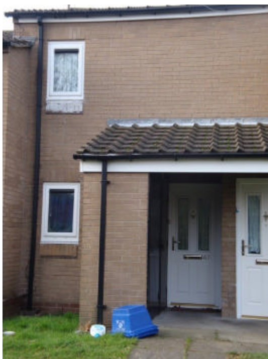
Casa de Tony em detalhes – número 67

Mesmo assim, reza a lenda que Tony tinha uma condição financeira um pouco melhor que a de seus companheiros de banda. Seus pais mantinham um comércio na própria Park Lane e ajudaram a banda no começo com a Van que eles usavam para fazer turnê.