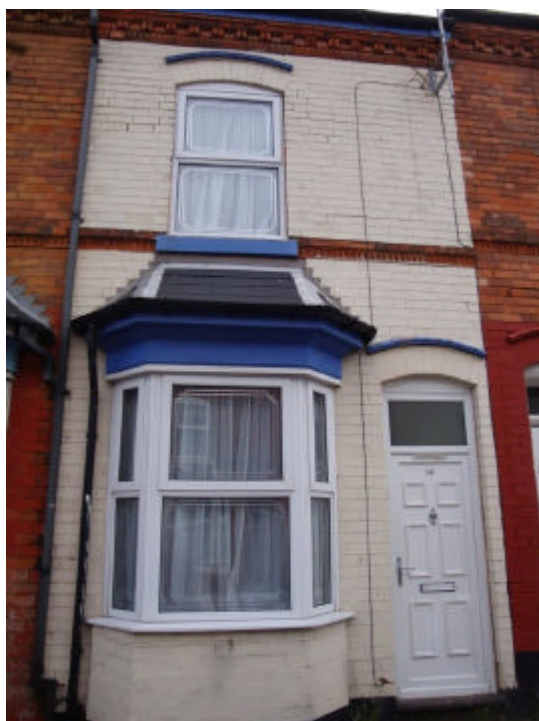
A casa – hoje reformada

Posso dizer que a rua é bem tranqüila, bastante próxima ao estádio, e com diversas casas geminadas, de igual construção em ambos os lados. A casa onde Ozzy viveu está hoje completamente reformada por fora e a pintura original laranja deu lugar à cor branca: fica fácil localizá-la.